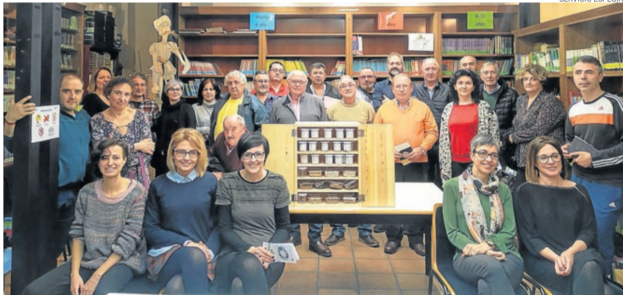
Casi 40 personas asistieron a la presentación de la biblioteca de semillas en La Almunia.

Las bibliotecas de semillas cuentan con la colaboración de las bibliotecas municipales de La Almunia, Morata de Jalón, Almonacid de la Sierra y Alpartir, al frente de las cuales serán los bibliotecarios quienes informen y presenten las semillas a los socios de la biblioteca que además podrán hacer uso de los libros