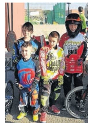
Los riders del club bmx.

La próxima cita deportiva que tenían prevista estos