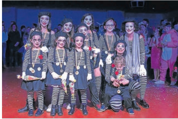
Otro de los grupos del carnaval de Lumpiaque.