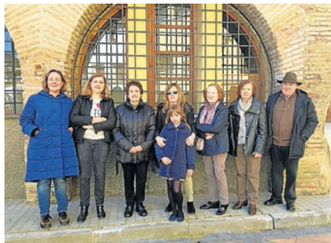
El 8M se reivindicó en Urrea de Jalón.