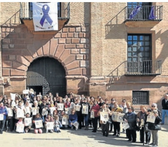
Muchos vecinos de Morata se unieron a la jornada.