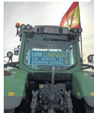
Uno de los tractores de Lumpiaque.

ciones futuras que decidan quedarse en sus pueblos y vivir del sector primario necesitan unas medidas reales para que puedan cumplir sus expectativas, y para ello es primordial que dichas reivindicaciones sean atendidas. ■