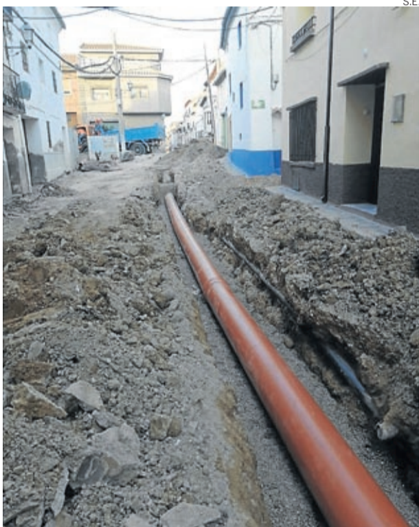
Se van a renovar tuberías y pavimento.

Ricla informa está disponible desde el pasado 1 de marzo y ha tenido una excelente acogida ya que en pocos días se han superado los 100 participantes. Una excelente herramienta para estar puntualmente informado. ■