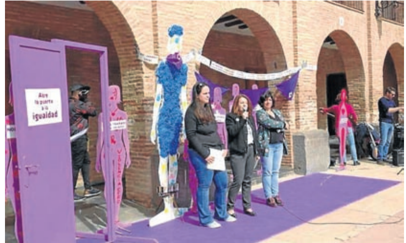
En La Almunia hubo concentración y lectura del manifiesto en la plaza.

Detrás de los actos organizados en La Almunia , que se prolongaron varios días, estuvo el ayuntamiento con la colaboración de asociaciones, comercios y centros educativos. Así, el domingo 8 más de un centenar de personas reivindicaron con música, lectura de manifiesto y una concentración, la igualdad entre hombres y mujeres en todos los ámbitos, laborales, familiares, sociales y salariales, entre otros. También hubo