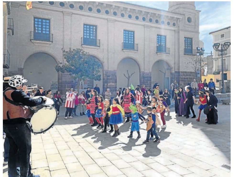
La charanga acompañó al pasacalles de Morata de Jalón.

co móvil portátil de Obbe durante los tradicionales desfiles de mascarutas los dos fines de semana que «contribuyó a crear un ambiente diferente y espectacular», añade.