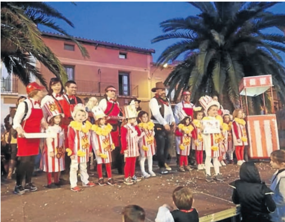
El concurso de disfraces de Calatorao permitió ver excelentes atuendos.