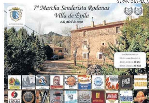
Cartel de la marcha a Rodanas, ahora aplazada.