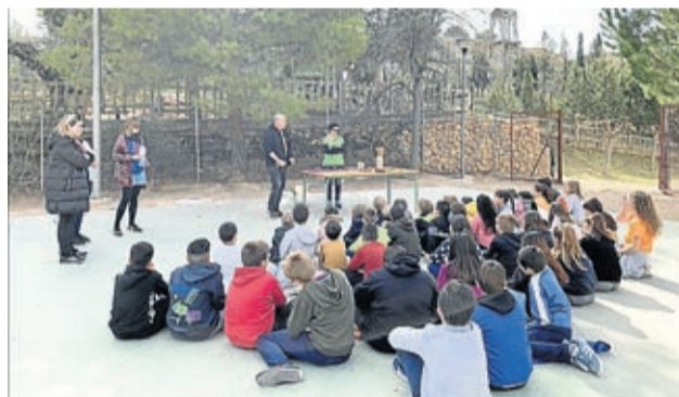
En Morata se realizó una actividad con los escolares.