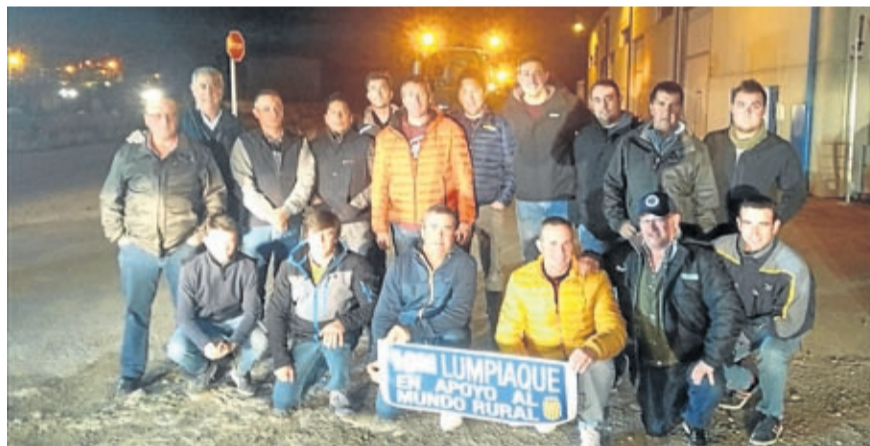
Un grupo de vecinos y agricultores de Lumpiaque se desplazó a Zaragoza.

El 10 de marzo, con motivo de la manifestación-tractorada celebrada en Zaragoza, una vez más los agricultores de Lumpiaque hicieron un parón en sus trabajos diarios para iniciar un largo camino hasta la capital arago-