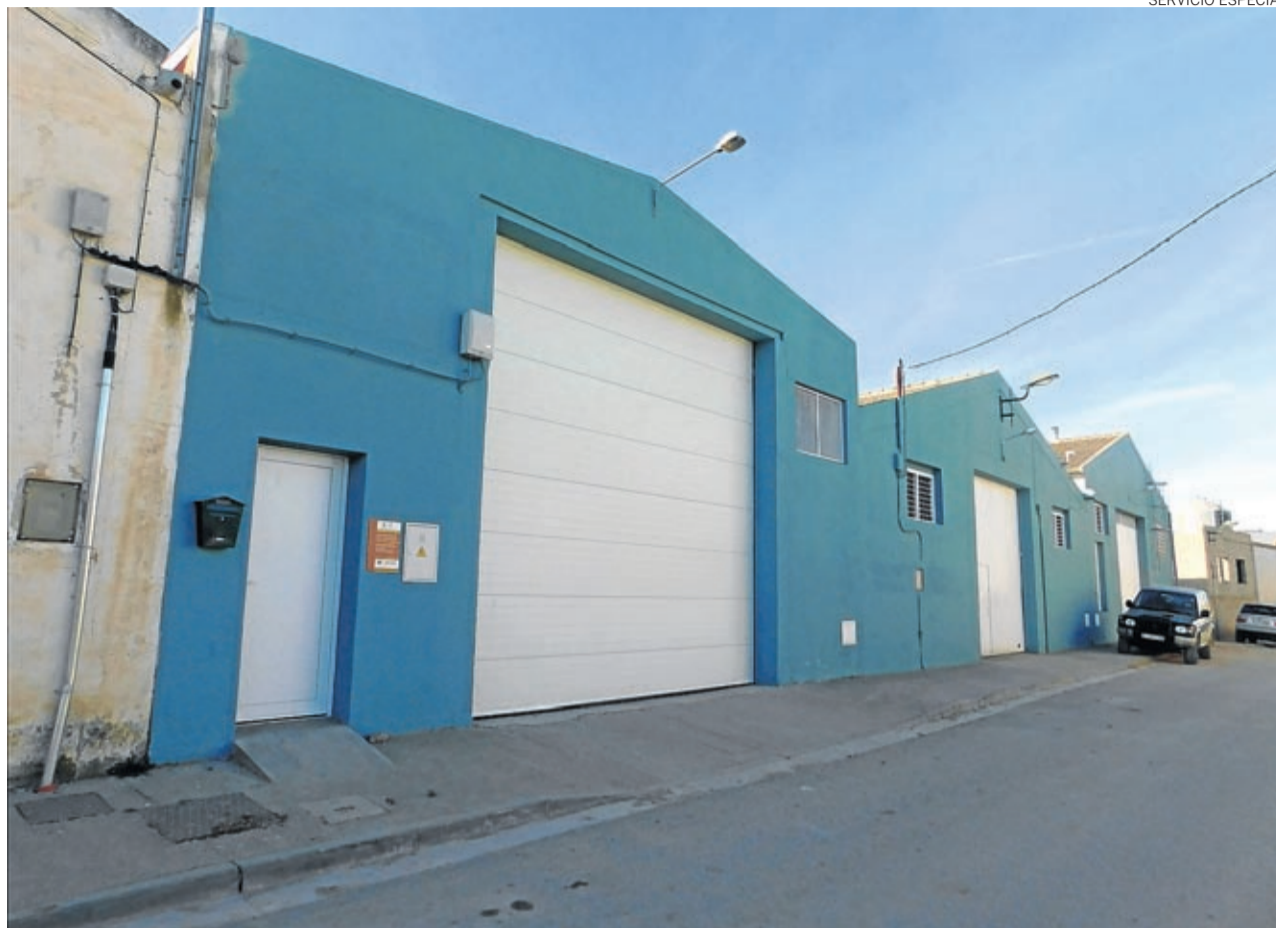
Instalaciones de Ganados Remiro SL en Épila.

En el año 2002, en la misma feria Valga y en presencia de varias autoridades locales y del Gobierno de Aragón, inauguramos nuestras instalaciones, un centro de tipificación de ovino con una pequeña fábrica de piensos donde se empezaría a cebar, clasifi-