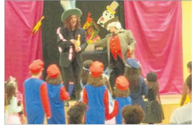
Los niños fueron protagonistas en Ricla.