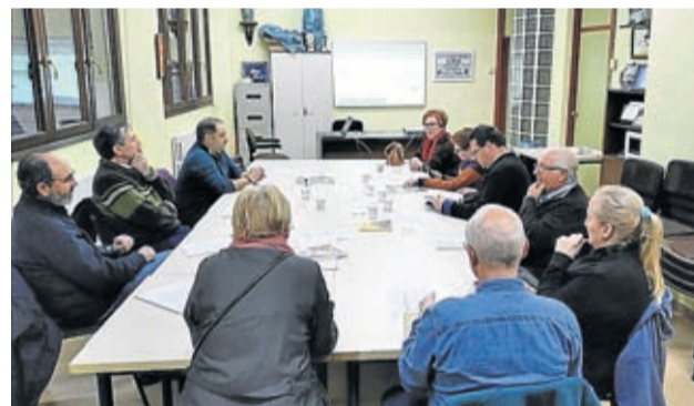
En Almonacid la presentación fue el 4 de marzo.

especializados en huertos y semillas que van a incorporarse al fondo bibliográfico de las bibliotecas, en la sección de la bibliohuerta .