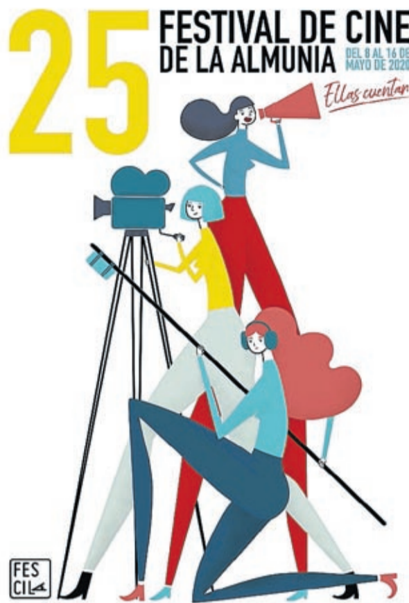
Cartel de la 25ª edición de Fescila.

En el caso de los cortometrajes, se han recibido cerca de 450 películas, cifra que también incluye los enviados desde los centros escolares de Primaria y Secundaria para participar en la categoría de Valores Educativos y Ciudadanos , una competición que hace dos años ya se amplió del ámbito autonómico al nacional gracias a la colaboración de la Fundación Manuel Giménez Abad. En los últimos