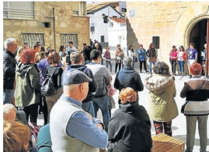
La Muela también salió a la calle.