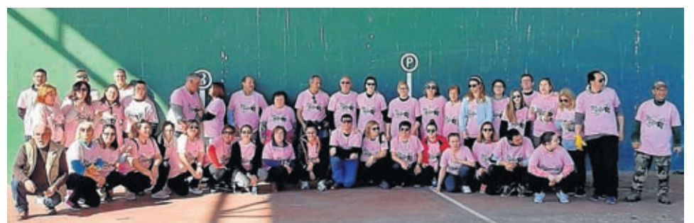
Plasencia hizo unas camisetas especiales para lucir en la marcha por la localidad.