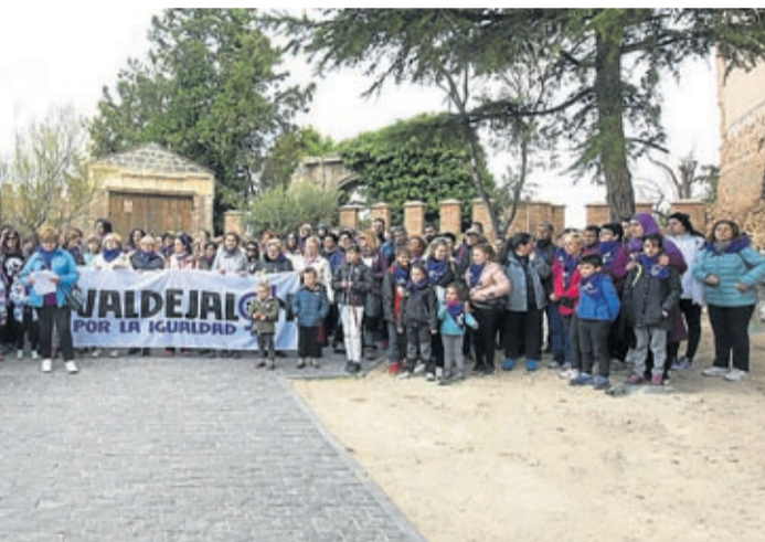
La marcha comarcal por la igualdad recorrió Calatraró.