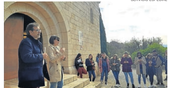
Los estudiantes de Gestión del Patrimonio en La Almunia.

El 26 de febrero visitaron La Almunia estudiantes del Máster en Gestión del Patrimonio Cultural de la Universidad de Zaragoza. Una actividad que buscó la aplicación real de los contenidos teóricos a través del uso del espacio patrimonial como escenario en el que los alumnos estén en contacto directo con la realidad de la gestión del patrimonio cultural y les ayude en el diseño de estrategias para la puesta en marcha de proyectos. Pero este programa también ha supuesto un acercamiento al estudio y al diagnóstico de proyectos municipales que son ejemplo de buenas prácticas.