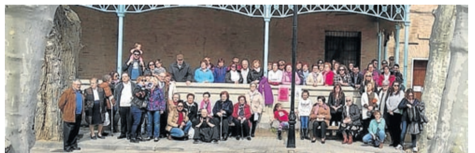
En Almonacid de la Sierra los vecinos leyeron el manifiesto en la plaza.