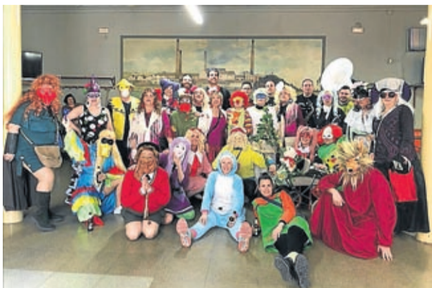
Mascarutas y zapateros son un clásico epileense.