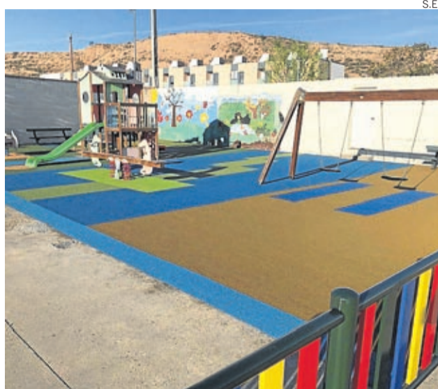
El parque tiene nuevo suelo de caucho para más seguridad.

Además de suponer una mejora en la seguridad, con esta actuación también se ha renovado la estética del recreo con un diseño y colores que