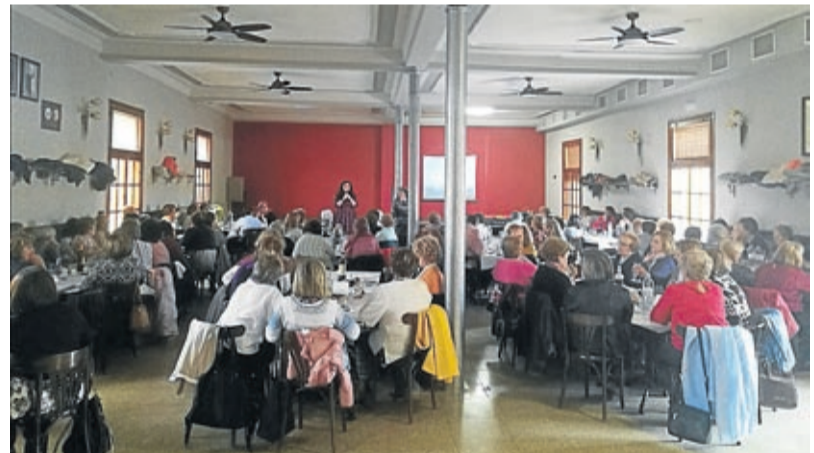
Andaban organizó la charla 'La mujer aragonesa ejecutiva' en Calatorao.