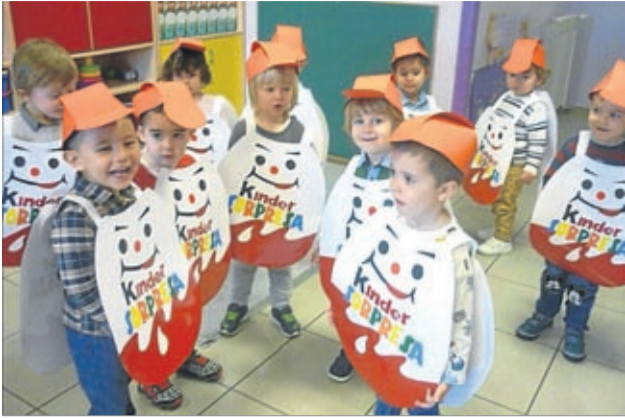
Los 'calatorines' vistieron de huevos Kinder.