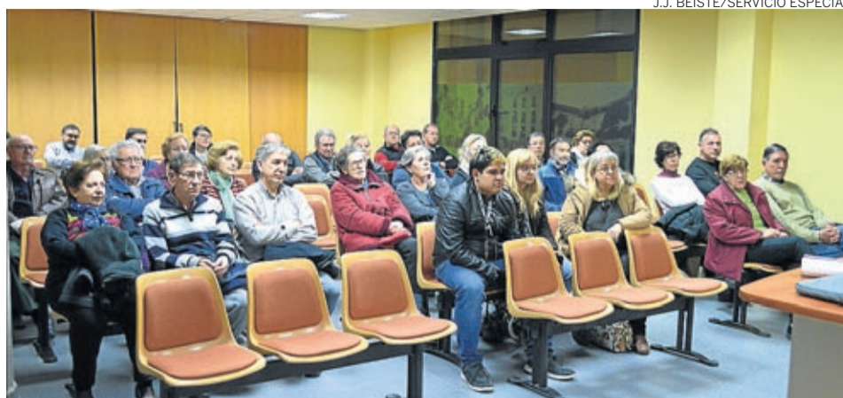
Antes de la visita a Bruselas se celebró un asamblea vecinal para recabar opiniones.

Para poder dar una mejor visión y más participativa de Morata de Jalón en este foro, Velilla convocó días antes, el 17 de febrero, una asamblea vecinal en la que tras una parte de exposición y debate, se acordó lo siguiente: respecto a las ventajas principales que aporta la industria a su pueblo, los vecinos destacaron la creación de puestos de trabajo y por lo tanto riqueza; la financiación de la población vía impuestos; la posibilidad indirecta de fijar la pobla-