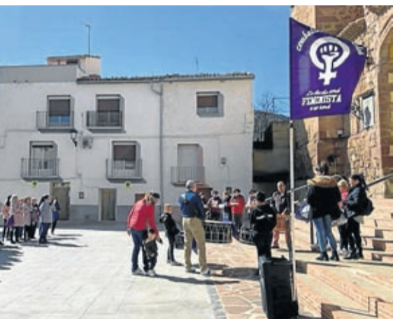
Alpartir volvió a programar una semana de actividades.