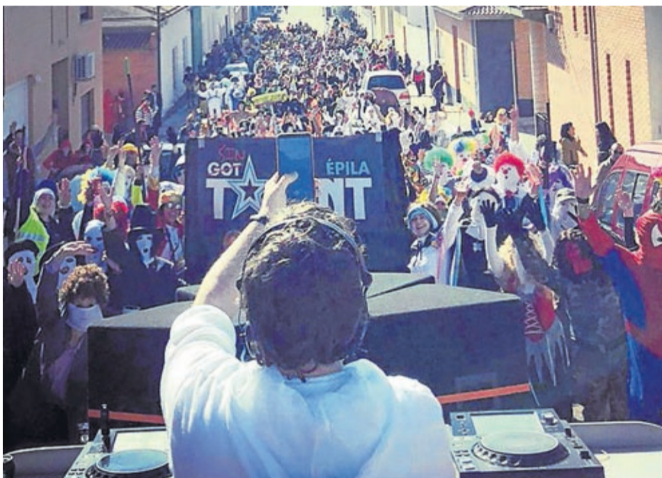
La disco móvil portátil dio un ambiente diferente a los desfiles de carnaval en Épila.