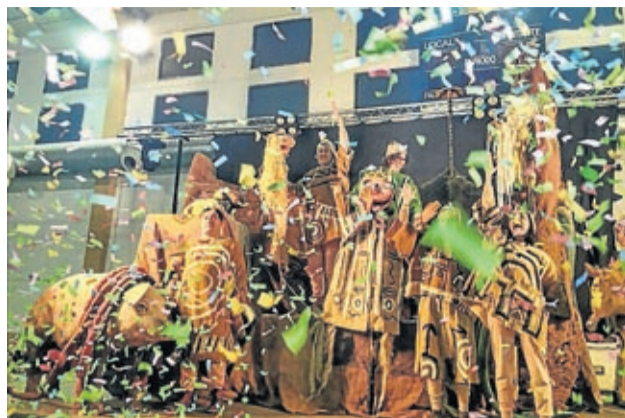
La PAI animó el carnaval en La Muela.