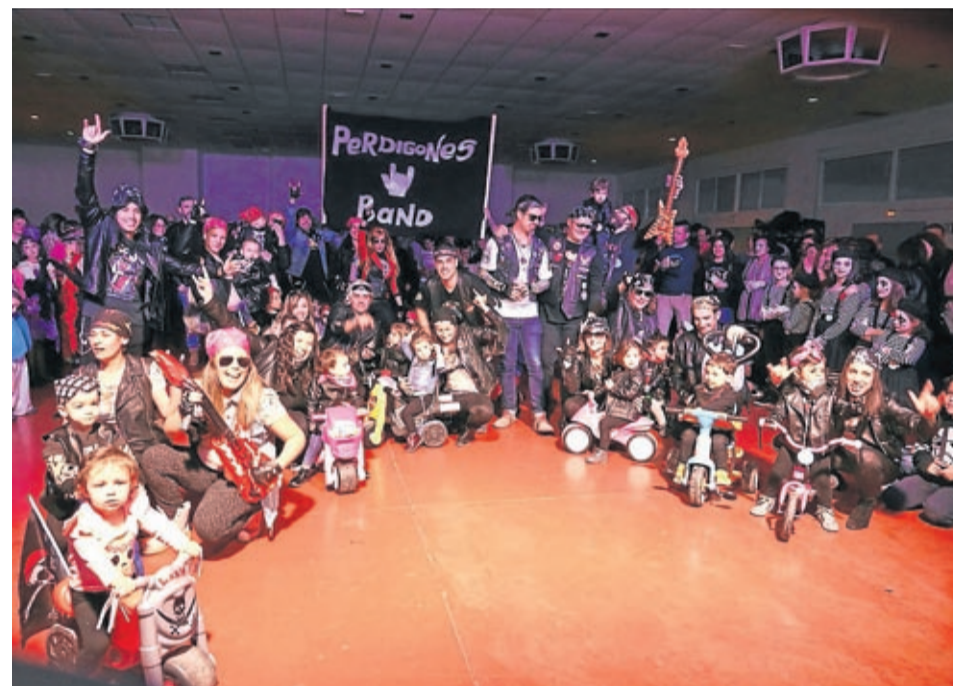
En Lumpiaque los vecinos lucieron elaboradas y originales creaciones.