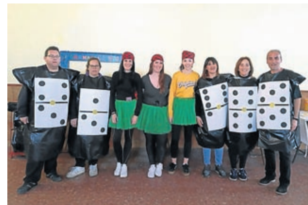
Los vecinos de Almonacid no dudaron en disfrazarse.