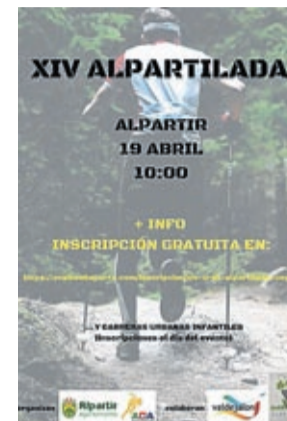
Cartel original de la prueba.

El próximo 19 de abril estaba prevista la celebración de la XIV Alpartilada en los alrededores de Alpartir, una prueba que ahora está condicionada a la mejora de la situación provocada por la rápida propagación del virus Covid-19.