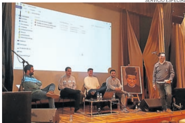
El alumnado conoció la trayectoria de antiguos alumnos.