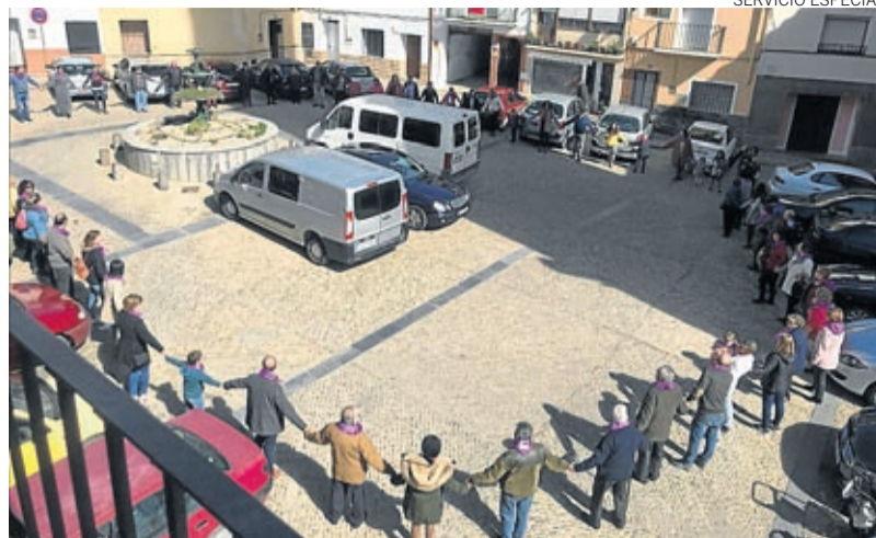
En Ricla se realizó una cadena humana en la plaza.