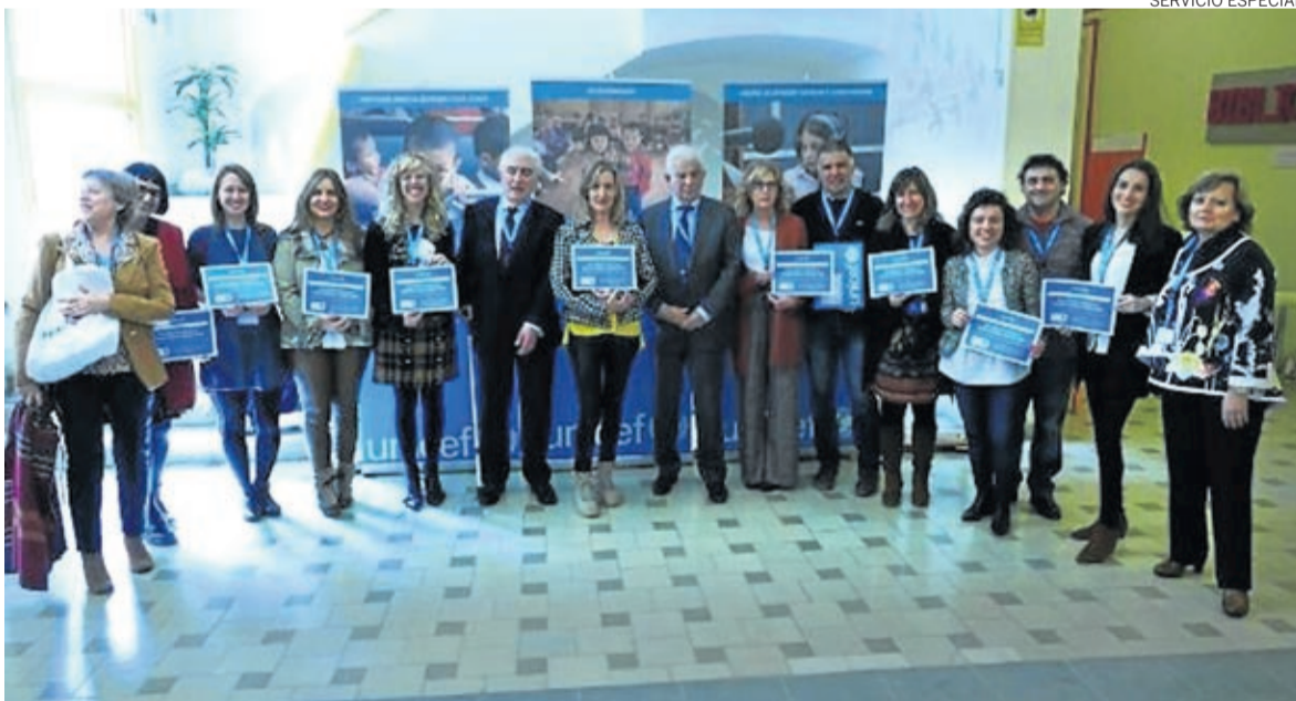
El CEIP Ramón y Cajal de Alpartir asistió al Encuentro de Escuelas Amigas de Unicef celebrado en Huesca.