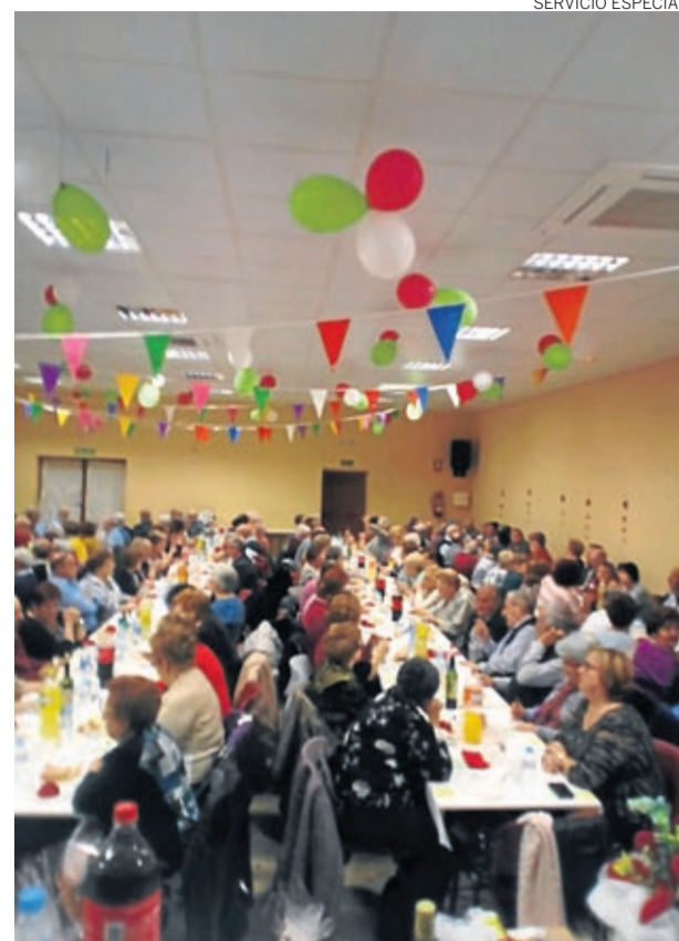
La merienda tuvo lugar en el salón de la Pista.