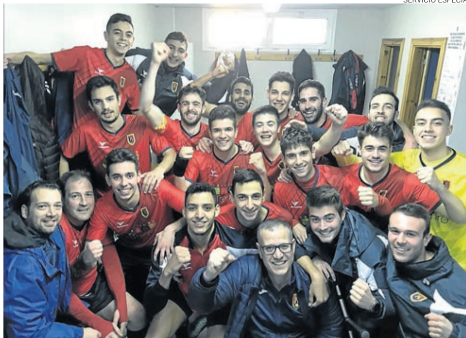
El CD Calatorao surgió en el 2015 tras la desaparición del fútbol un año antes en la localidad.

El Club Deportivo Calatorao se estrenó en la categoría Regional Preferente, tras el as-