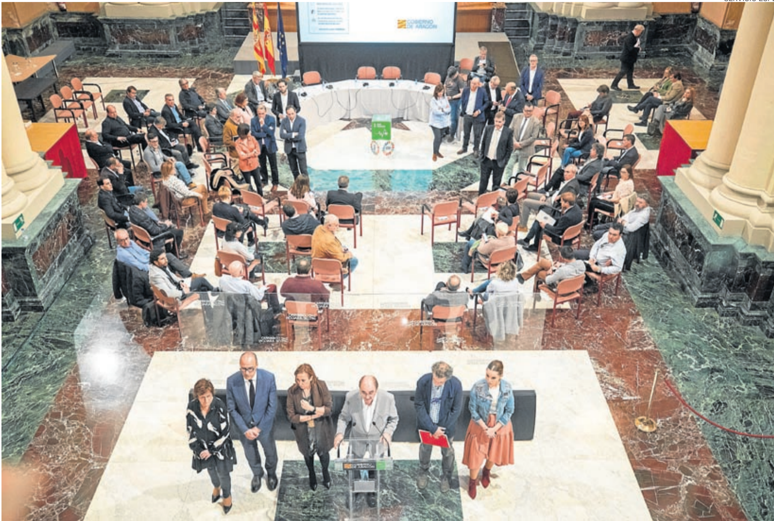
El presidente de Aragón reunió el 12 de marzo a los responsables de las principales instituciones aragonesas para fijar cauces de cooperación.