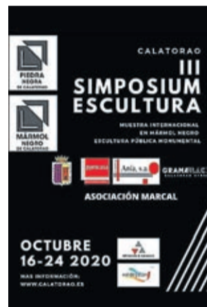
Cartel del simposio.

un evento artístico permite poner el valor la piedra de Calatorao y sus múltiples usos acabados. ■